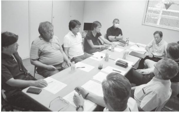
合同会議 (昨年) の様子

第274号 発行所 東京都タイル煉瓦工事工業協同組合 発行人 上島康秀 編集人 広報部 東京都新宿区市谷田町 2-29 こくほ 21・4F (〒162-0843) ☎03 (5225) 6466 FAX03 (5225) 6477