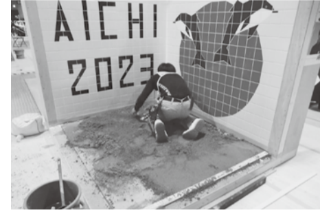
技能五輪・61回大会の様

第62回技能五輪全国大会が11月22日(金)〜25日(月)にかけて、愛知県で開催される。 タイル張りの職種は前大会と同じ常滑市セントレア愛知県国際展示場で行われ、23日(土) 8時30分〜16時45分(作業時間7時間)、24日(日) 8時30分〜12時00分(作業時間3時間30分)の2日間で競技課題を作成する。 競技では壁・床を想定した下地に定められた仕様に基づいてタイルを張り、目的地語を行う。 今大会に参加する選手は4人と、直近の3大会では最少人数となつてしまつたが、これからのタイル工事業界を担う若者たちが、日頃の鍛錬の成果を競い合い、真剣に課題に挑む姿を、ぜひ会場で応援してほしい。